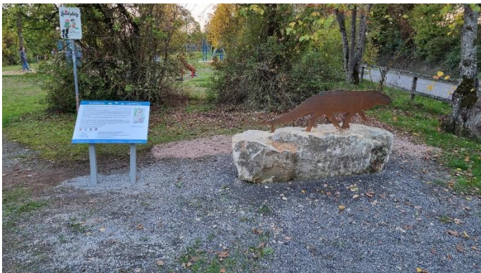
Abb. 4: Panoramatafeln und Saurierlief am Wanderpfad zwischen Niederlauer und Burglauer; Fotos: Holger Schmitt