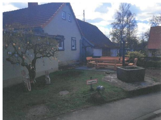
Abb. 8: Die neue Sitzbankgruppe am Dorfbrunnen;