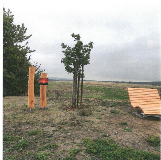
Abb. 13: Panoramatafel und Besinnungsstation in Rödelmaier