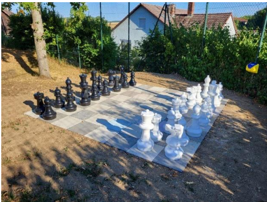
Abb. 11: Das überdimensionale Schachfeld