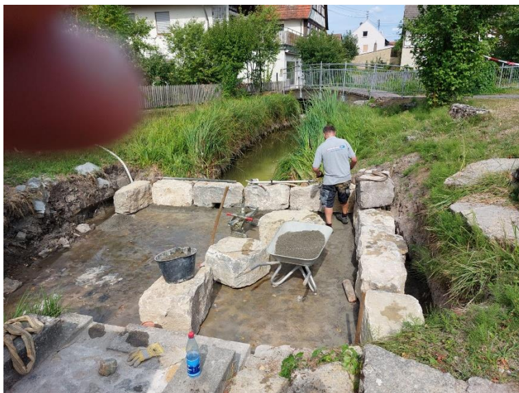
Abb. 2: Barfußpfad und Wasserspielplatz in der Ortsmitte von Großwenkheim; Fotos: Arno Schlembach