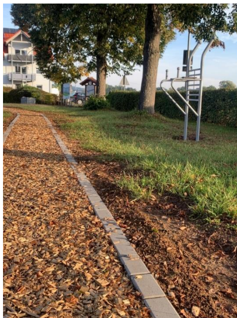
Abb. 7: Fitnessparcours mit Finnenweg am Spielplatz Burglauer; Foto: Marco Heinickel