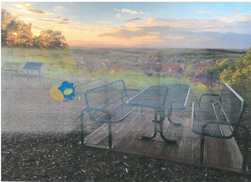
Abb.12: Sitzgelegenheit am Affhügelblick