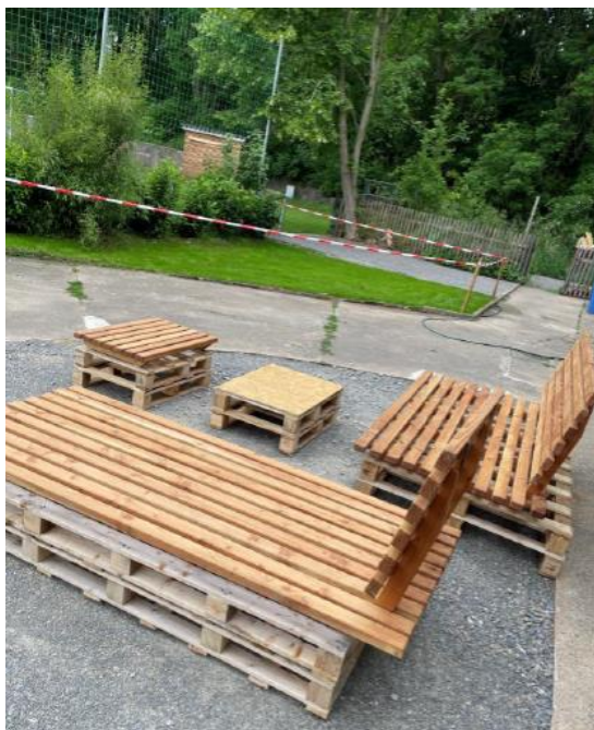
Abb. 6: Innen- und Außeneinrichtung des neuen Jugendclubgebäudes in Unsleben; Fotos: Chris Werner