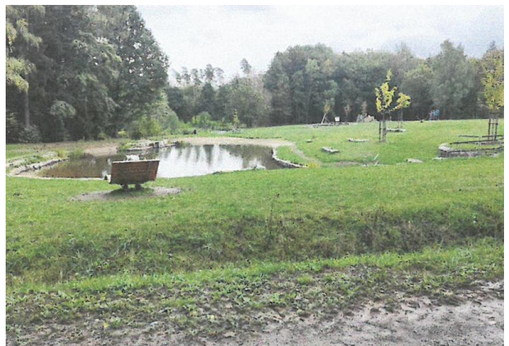
Abb. 9: Die Waldsofas am Wald-Boden-Klima-Infopark