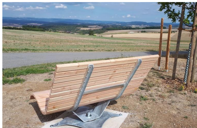
Abb. 14: Sitzgelegenheiten