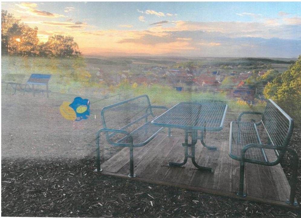
Abb.12: Sitzgelegenheit am Affhügelblick