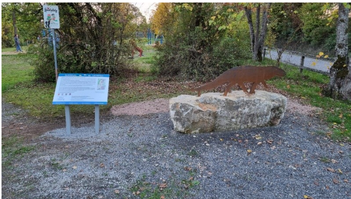
Abb. 4: Panoramatafeln und Saurierlief am Wanderpfad zwischen Niederlauer und Burglauer