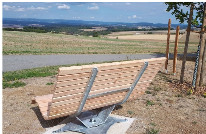
Abb. 14: Sitzgelegenheiten; Fotos: Walter Wohlfromm