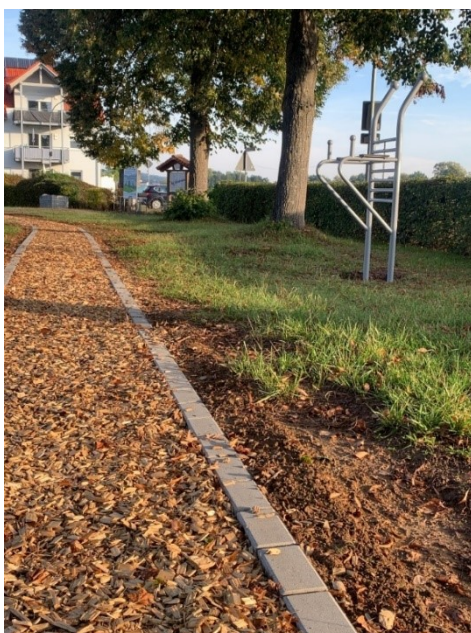
Abb. 7: Fitnessparcours mit Finnenweg am Spielplatz Burglauer; Foto: Marco Heinickel