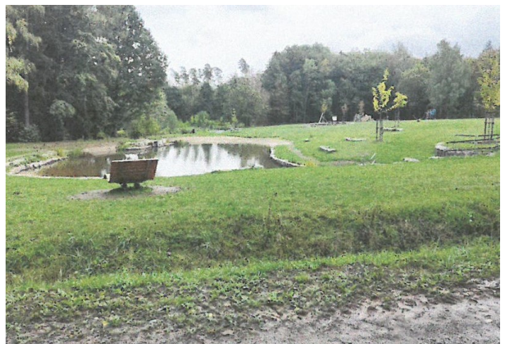
Abb. 9: Die Waldsofas am Wald-Boden-Klima-Infopark; Fotos: André Härder