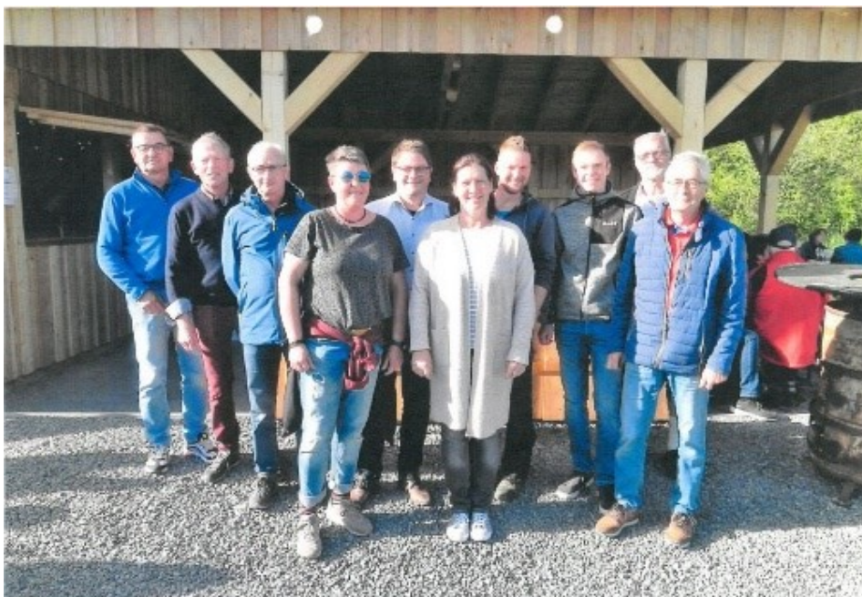
Abb. 5: Ehrenamtliche Helfer vor der Schutz-, Ausschank – und Verweilhütte; Foto: Johannes Hümpfner