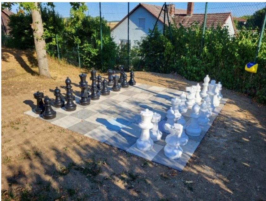
Abb. 11: Das überdimensionale Schachfeld