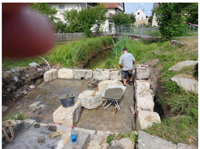
Abb. 2: Barfußpfad und Wasserspielplatz in der Ortsmitte von Großwenkheim