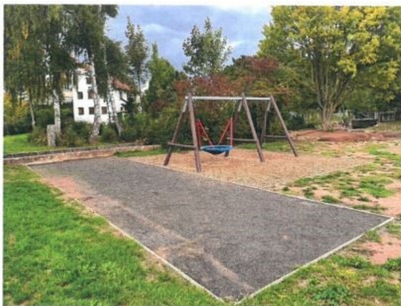
Abb. 3: Boule-Platz am Spielplatz an der Kirche