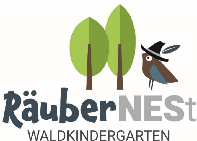
Abb. 15: das Logo des Waldkindergartens und die Kinder beim Workshop im Wald; Logo: NES-Allianz