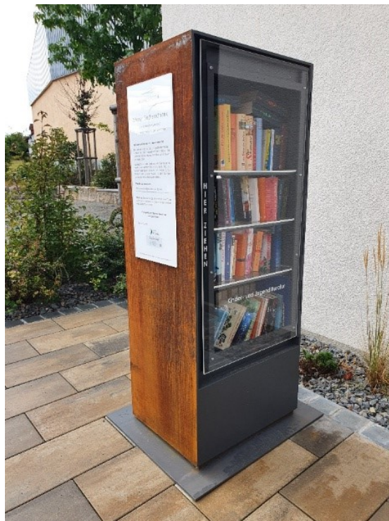
Abb. 10: Der Bücherschrank am Standort in Windshausen; Foto: Georg Straub