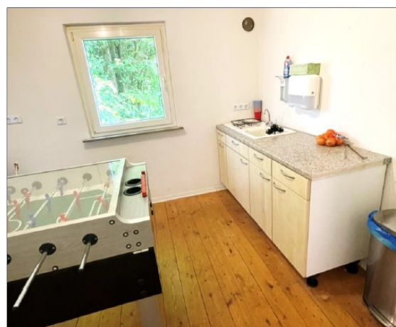
Abb. 6: Innen- und Außeneinrichtung des neuen Jugendclubgebäudes in Unsleben