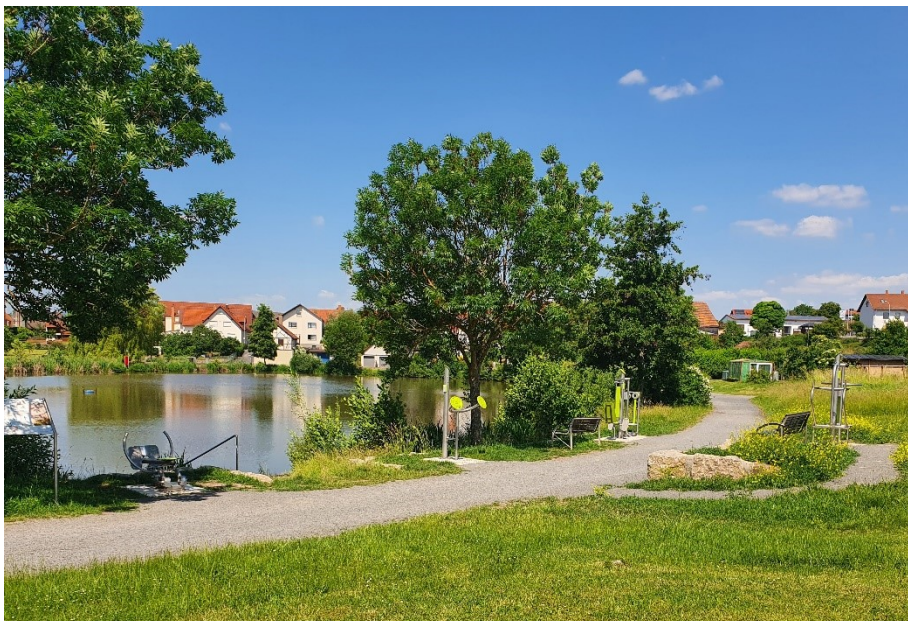
Abb.: Fitnessgeräte am Dorfsee