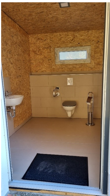
Abb. 16: Barrierefreie Toilettenanlage