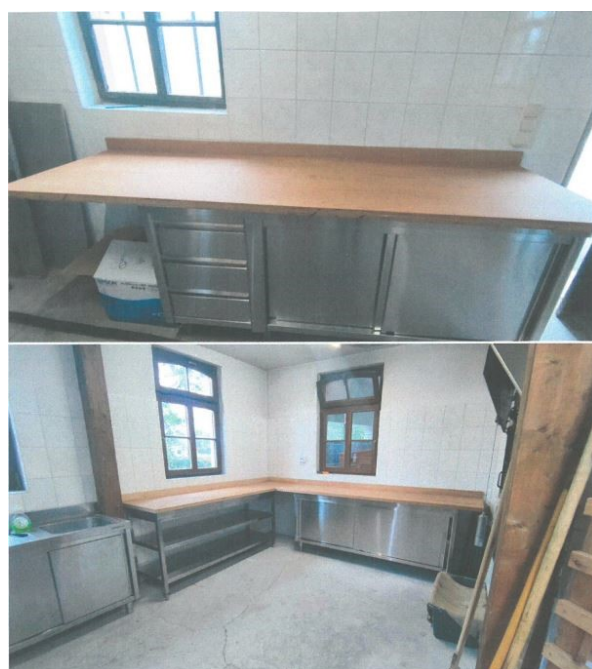
Abb. 1: Backofen und Arbeitsbereich im Dorbackhaus Althausen; Fotos: Steffen Schneider