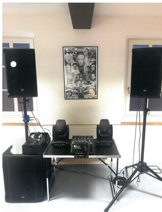
Abb. 17: Ton- und Musikanlage des Jugendclubs

Gesamtkosten (brutto): Zuwendung: 6.041,10 € 4.112,34 €