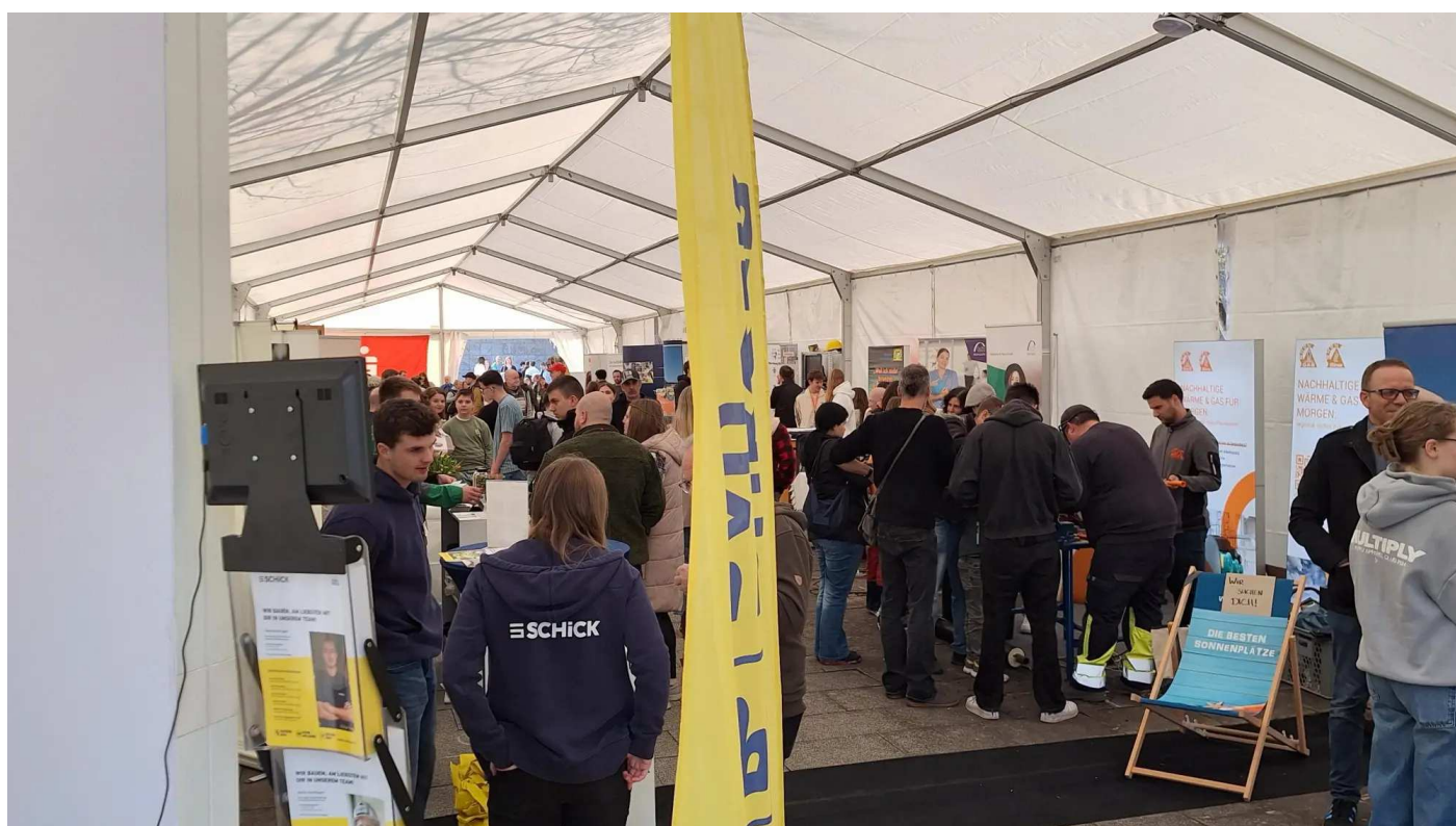
Infotag Jugend und Beruf Messezelt.

Der diesjährige Infotag „Jugend & Beruf“ am Standort der Berufsschule und der Wirtschaftsschule in Bad Neustadt war einmal mehr eine beliebte Plattform für Berufsorientierung in der Region. Vor kurzem informierten sich mehrere hundert junge Menschen aus Bad Neustadt und dem Umland — teils mit Eltern, teils mit Freundinnen und Freunden — von 10 bis 14 Uhr über die zahlreichen beruflichen Zukunftschancen vor Ort. Insgesamt präsentierten sich 86 Aussteller aus der Region und machten auf freie Ausbildungsplätze und duale Studienangebote aufmerksam. Viele Stände boten praxisnahe Einblicke. Schon im Vorfeld konnten sich Schülerinnen und Schüler sowie Eltern über die Aussteller beim Infotag informieren: Auf der Internetseite jugend-beruf.de , die von der Nes-